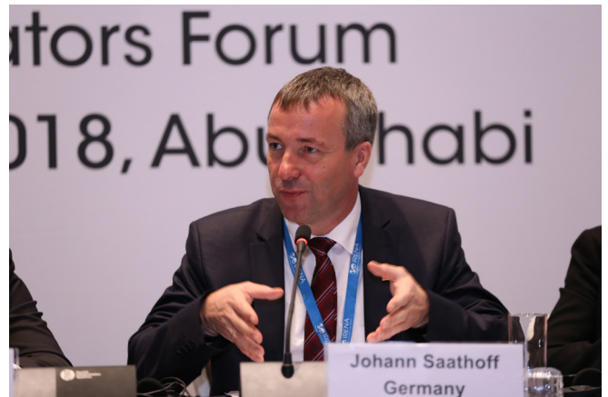
Johann Saathoff, député, Allemagne

La question des bioénergies a aussi été largement abordée, et il a été expliqué que l'alimentation d'un système énergétique sobre en carbone uniquement par l'électricité était improbable d'ici à 2050. Certains parlementaires ont fait observer qu'il faudrait de toute façon utiliser dans une certaine mesure du carbone, mais que la forme la plus propre et la plus durable de carbone était probablement celle qui résidait dans les bioénergies. Cependant, la durabilité d'une telle solution inquiétait certains participants. Une autre solution serait d'utiliser un carburant synthétique, mais son efficacité a été mise en doute ; l'hydrogène pourrait également être une option, mais il semblerait que cette technologie soit fortement consommatrice en eau. Certains parlementaires ont exhorté leurs homologues à bien réfléchir aux contreparties de technologies, jugées par certains comme n'étant pas encore tout à fait matures.