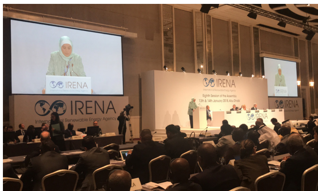
Wafa Bani Mustafa, députée, Jordanie, rendant compte du Forum des législateurs 2018 à la huitième Assemblée de l'IRENA

Suite aux conclusions tirées de ses délibérations, le Forum des législateurs a rendu compte à l'Assemblée de l'IRENA, qui a pris note des discussions qui s'étaient tenues. Le texte qui suit est celui du rapport à l'Assemblée sur le Forum des législateurs IRENA 2018.