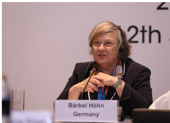
Bärbel Höhn, ancienne députée, représentante spéciale pour l'énergie en Afrique – ministre fédéral de la coopération et du développement économiques

Des parlementaires venant d'Allemagne et de Belgique ont reconnu que d'importants progrès avaient été réalisés dans leur pays respectifs. Le 1 er janvier 2018, un cap historique a été