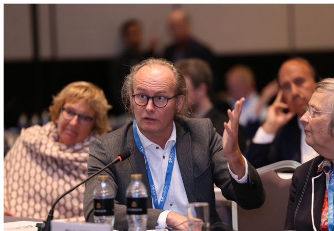
Claude Turmes, député, Union européenne

Pour relever le défi du financement et de l'aspect bancable des projets, des membres de ce groupe ont souligné que pour renforcer la confiance des investisseurs et mobiliser des financements en faveur de projets liés aux énergies renouvelables, il convient de proposer des instruments efficaces d'atténuation des risques, y compris des garanties pour les acquéreurs et des mécanismes de couverture des risques liés