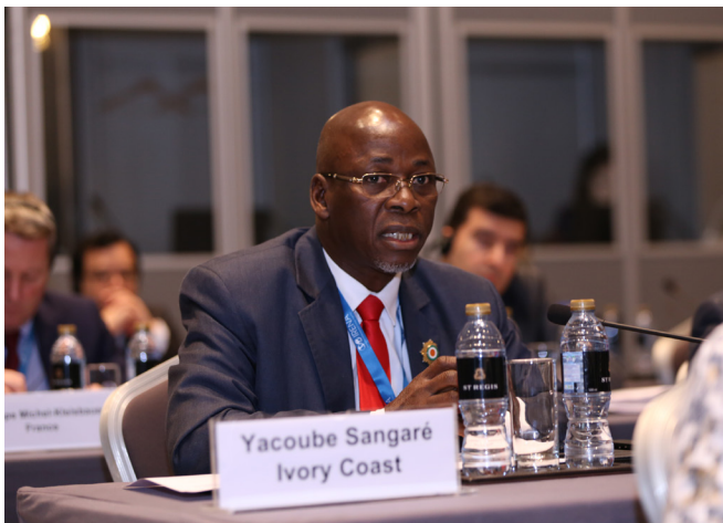
Yacoube Sangaré, député, Côte d'Ivoire

Pour faire le choix politique de ne pas exploiter leurs ressources en combustibles fossiles et de passer sans transition à un système énergétique propre, les pays en développement auraient besoin d'un soutien financier. Il conviendrait alors d'explorer les possibilités d'utiliser le financement pour le climat en faveur des énergies renouvelables dans le cadre des CDN. Des discussions ont d'ailleurs été engagées dans ce sens, afin d'encourager le Fonds vert pour le climat à être plus efficace lorsqu'il s'agit d'accélérer le développement des énergies renouvelables grâce à ses financements. Un membre de la délégation de l'assemblée parlementaire de l'OTAN, qui